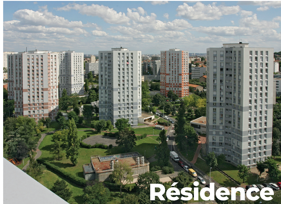
Résidence Champs aux Melles